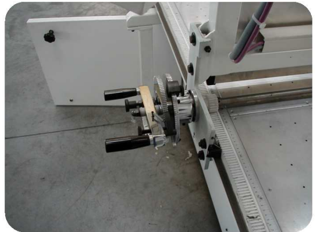
Sistema meccanico ripetitivo Mechanical repeating system