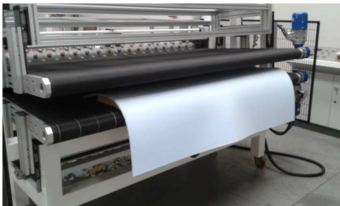
Nastro pressa Compression belt

OPTION: set of not-standard profiled rollers, winding/unwinding device (bobbin working), compression belt, equipment for changing rollers