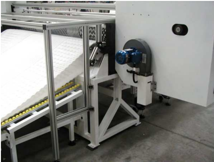
Banco di scarico a rullini Unloading roller table